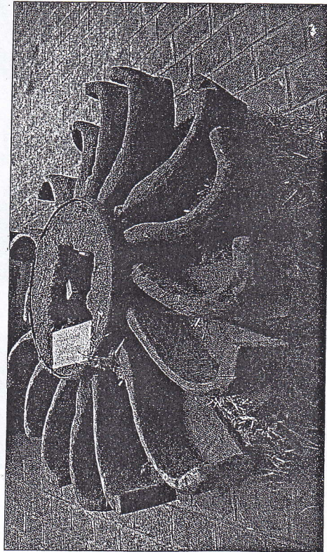
Roue Horizontale (kruffell).

A une époque imprécise, en Occident tout au moins, les roues horizontales disparaissent au profit des roues verticales, puis celles-ci cèdent à nouveau la place aux roues horizontales.